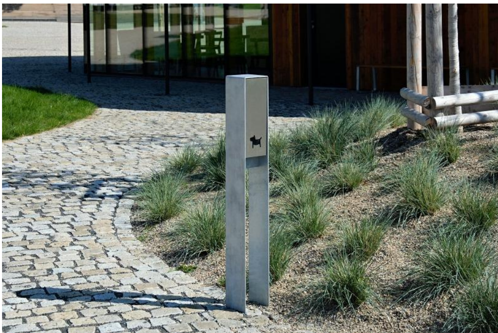
Design mobiliáře je chráněn autorským zákonem

Popis Držák sáčků na psí exkrementy, navržen na papírové sáčky. Otvory pro kotvení do podkladu.